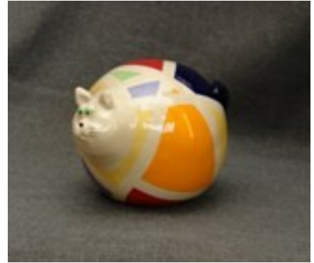
Foto: Rafaga (kat van zo'n 20 cm. A-symmetrisch met 8 felle kleuren gedecoreerd. Ook hij is steengoed gebakken (1240 o Celsius).

beter aan elkaar laten hechten van kleionderdelen.