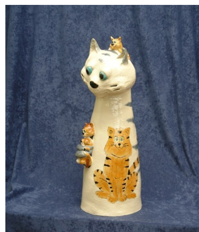
Foto: Koterkunst (steengoed gebakken en geschikt voor de tuin, zo'n 60 cm hoog. Het stelt ma met de kleintjes voor, terwijl pa rustig toekijkt)